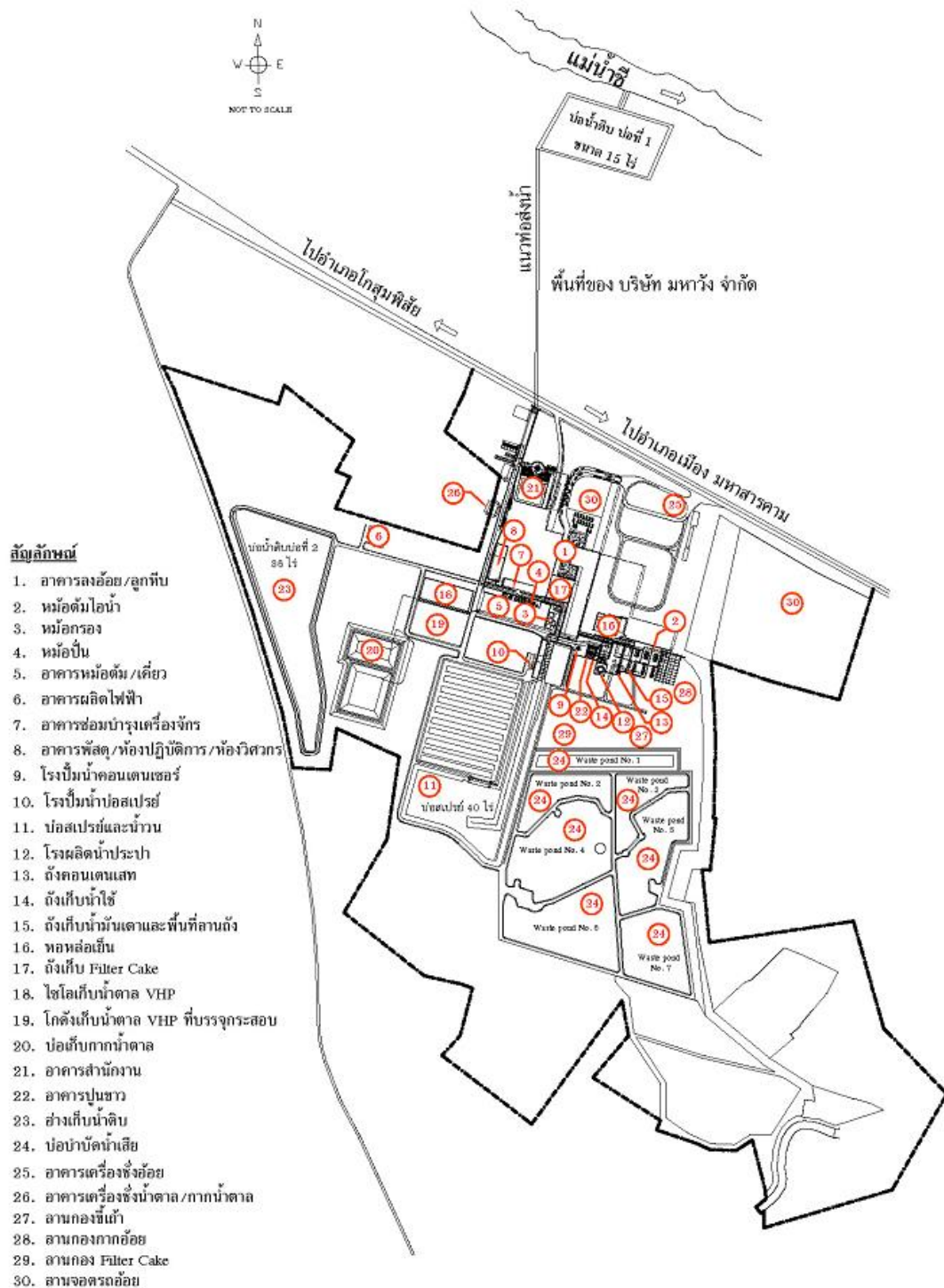
รูปที่ 1.2-3 ลักษณะการใช้ที่ดินภายในโครงการ